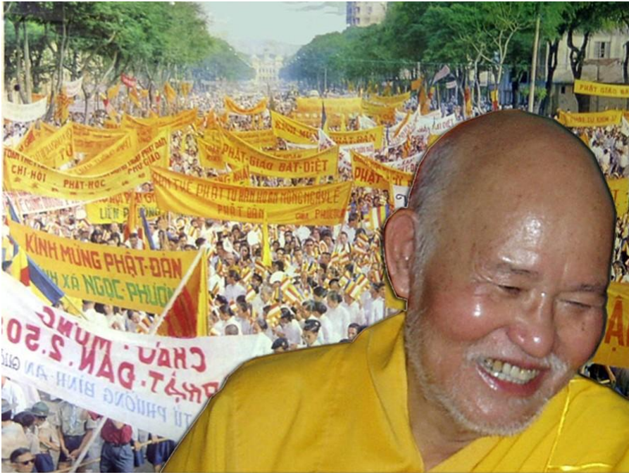
Phật Đản năm 1964 tại Saigon

Dân tộc Việt Nam thực hành đạo Phật vì đạo Phật là chìa khoá mở ra một thế giới an lạc, hạnh phúc, với lòng bao dung, khoan hoà, và từ bi vô hạn, mở ra một xã hội người, với sự tôn trọng, bảo vệ con người trong sự chia sẻ đồng đều từ vật chất tới giác ngộ. Trên quan điểm con người tự do, có văn